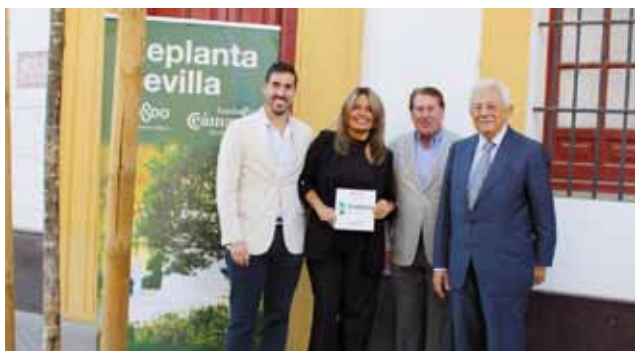
Migasa en la calle Adriano.