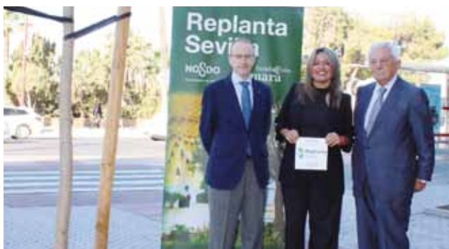
Helvetia Seguros en el Paseo de Cristóbal Colón.