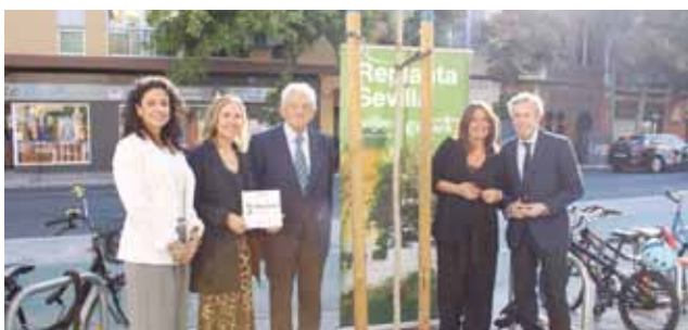
Consortio Jabugo en calle Recaredo.