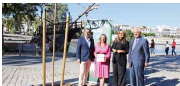
Llopis Servicios Ambientales en Marqués del Contadero.

El proyecto sigue abierto a nuevas incorporaciones y además está en funcionamiento la iniciativa 2.0, a través de la web www.replantasevilla.com en la que cualquier sevillano/a puede apadrinar la plantación de un ejemplar para la próxima campaña.