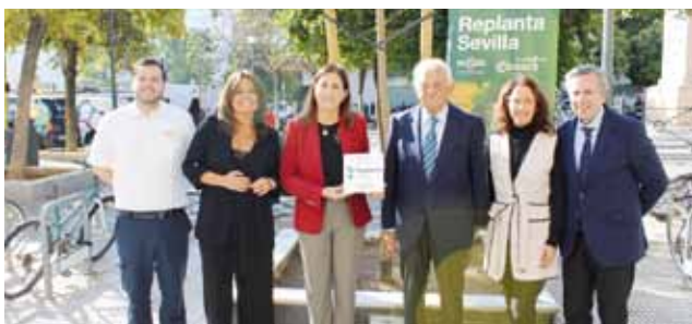
Fundación MAS en Plaza de la Gavidia.