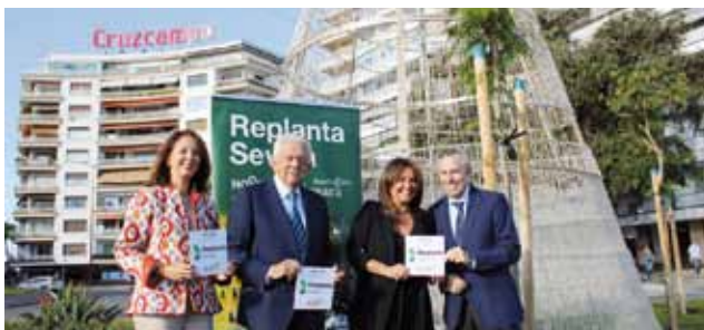
Lamaignere en Plaza de Cuba.