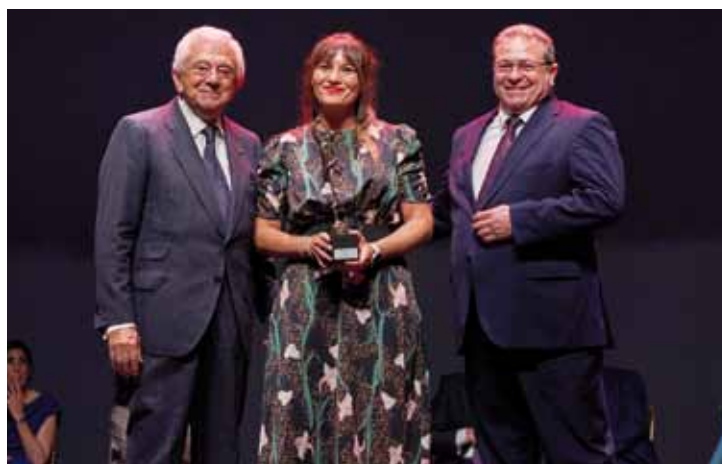
PREMIO APUESTA POR SEVILLA RYANAIR