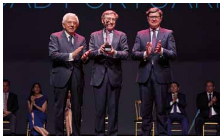
PREMIO A LA INICIATIVA EMBLEMÁTICA AUTORIDAD PORTUARIA DE SEVILLA