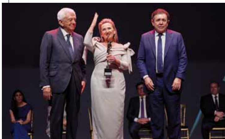
PREMIO A LA SOSTENIBILIDAD LLOPIS