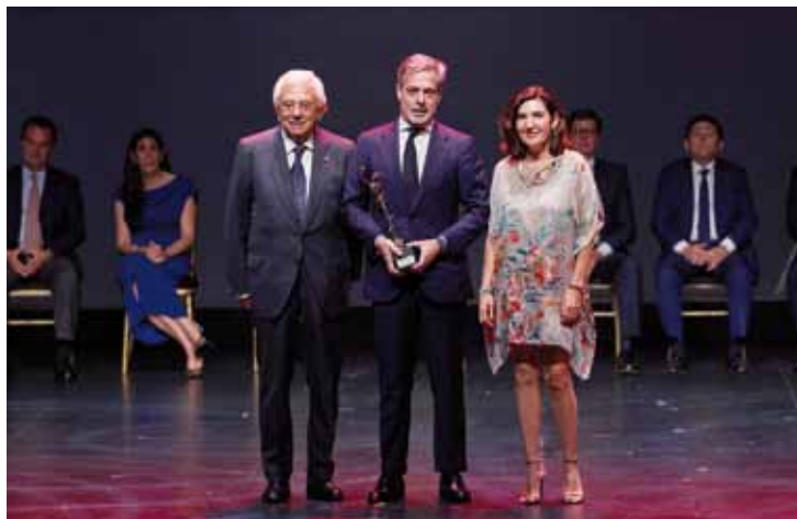
PREMIO A LA INTERNACIONALIZACIÓN COX