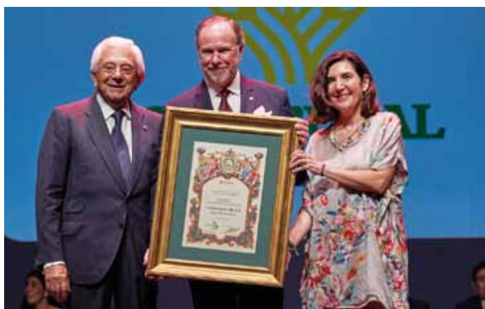
25 ANIVERSARIO CAJA RURAL DEL SUR