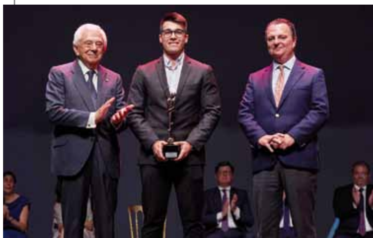
PREMIO APUESTA POR SEVILLA VUELING