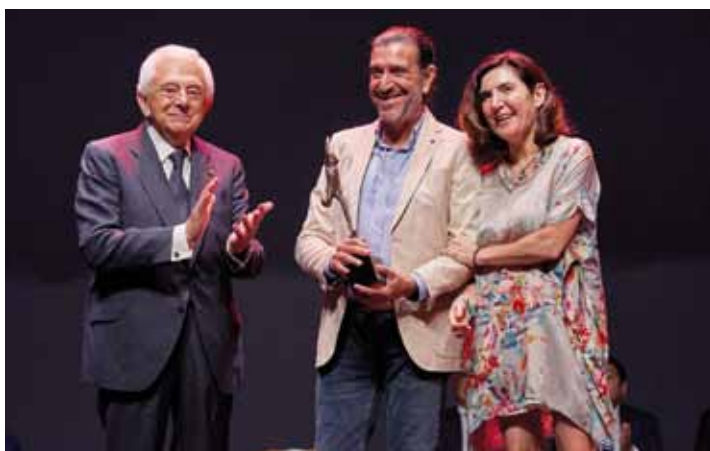
PREMIO A LA STARTUP SCOOBIC