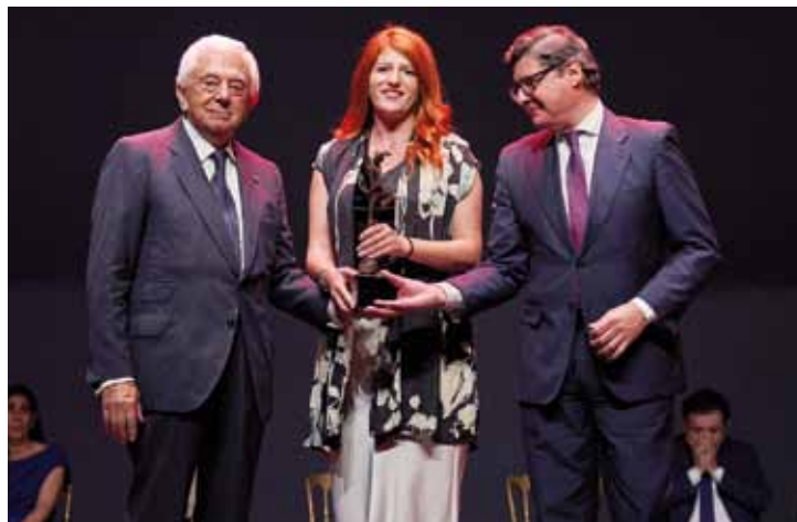
PREMIO A LA INNOVACIÓN DUPONTE