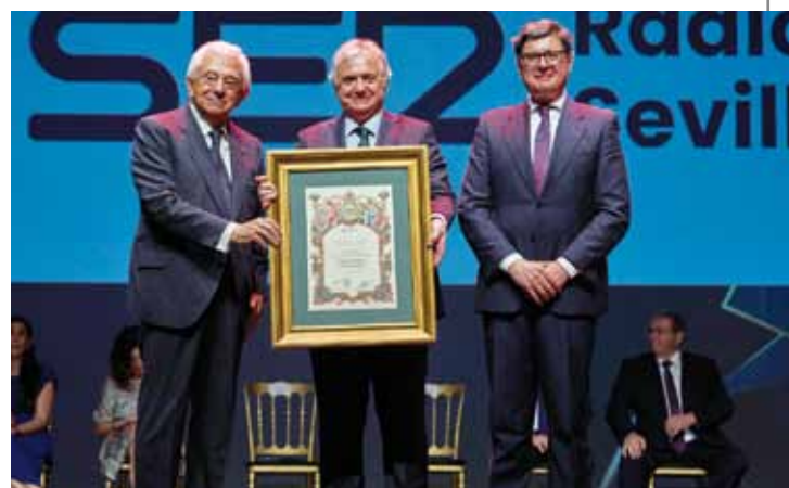
CENTENARIO RADIO SEVILLA