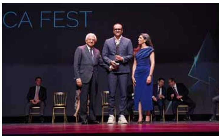
PREMIO A LA INICIATIVA TURÍSTICA ICÓNICA SANTALUCIA SEVILLA FEST